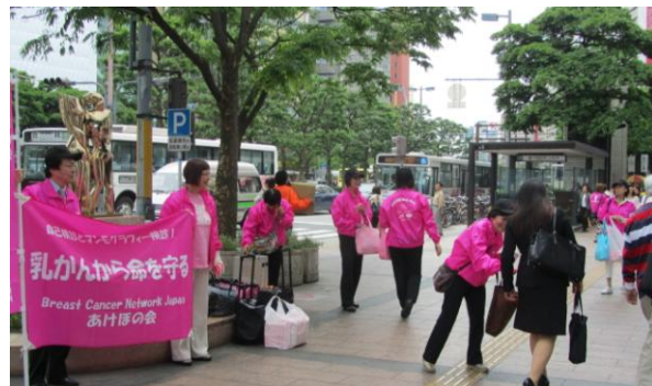
2012/5/13 母の日キャンペーン(福岡市中央区天神にて)

<Breast Cancer Network Japan—あけぼの会>のネットワークの一員として、福岡を中心に活動しています。あけぼの精神「再び、誇り高く美しく」を大切にして、体験者同士、励まし合って一緒に頑張っていきたいと思っています。