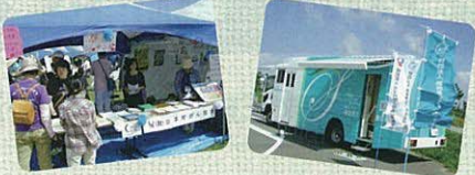
【乳がん】40歳以上の女性で1年以内に検診を受けていない方(先着40名様) 【肺がん】20歳以上の男女で1年以内に検診を受けていない方(先着60名様)