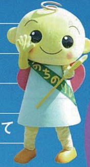
がん啓発キャラクター ふっぴー

参加者それぞれが交代でタスキをつながながら歩き、 生きる希望や勇気が生まれることを目指します。 どなたでも参加出来るチャリティイベントです。 ”命の大切さ” ”予防・早期発見の大切さ”を地域一丸となって 社会に訴え、一緒に歩いて生(行)きませんか?